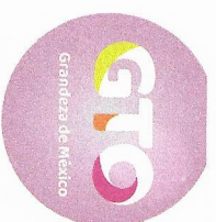
TABLA DE APLICABILIDAD DE OBLIGACIONES DE TRANSPARENCIA 2021 XICHU, GTO.