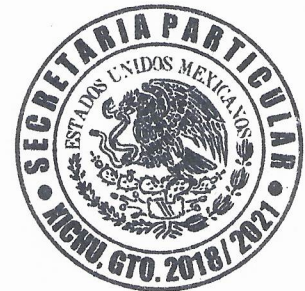
T.S.U. Abbat Sadat Villa Varela Secretario Particular

Xichú, Gto., a 15 de Septiembre del 2020